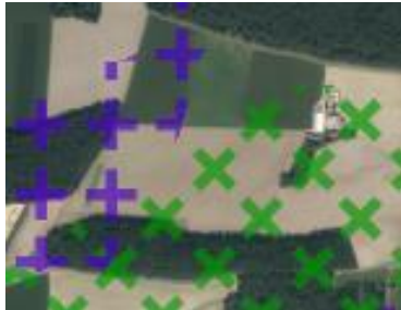
Kartenausschnitt 2: Auszug aus RISBY online – Vorbehaltsgebiet für Bodenschätze and Landschaft

Im Regionalplan Region Regensburg verläuft über den westlichen Teil des Planungsgebietes (lila Kreuze) das Vorbehaltsgebiet für Bodenschätze (Sand) SD 7 „nördlich von Trischlberg“. Über dem mittleren und östlichen Flächenteil liegt das landschaftliche Vorbehaltsgebiet Östlicher Albtrauf und Schwaighauser Forst (13) (grüne X). Im Übrigen sind die Flächen regionalplanerisch unbeplant.